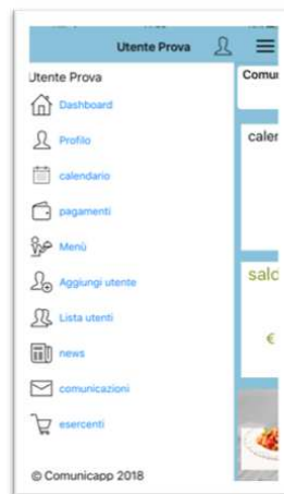
Menu di navigazione