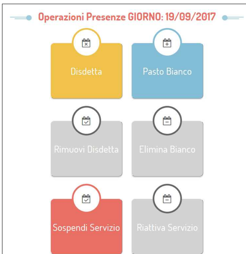
Portale Genitori 2: Menu delle operazioni possibili per il giorno di calendario selezionato

UFFICIO SERVIZI SOCIALI E PUBBLICA ISTRUZIONE