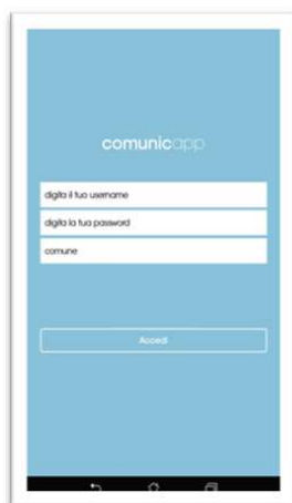
Login e scelta comune