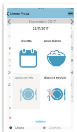
Scelta disdetta, pasto in bianco, Attivazione/disattivazione servizio