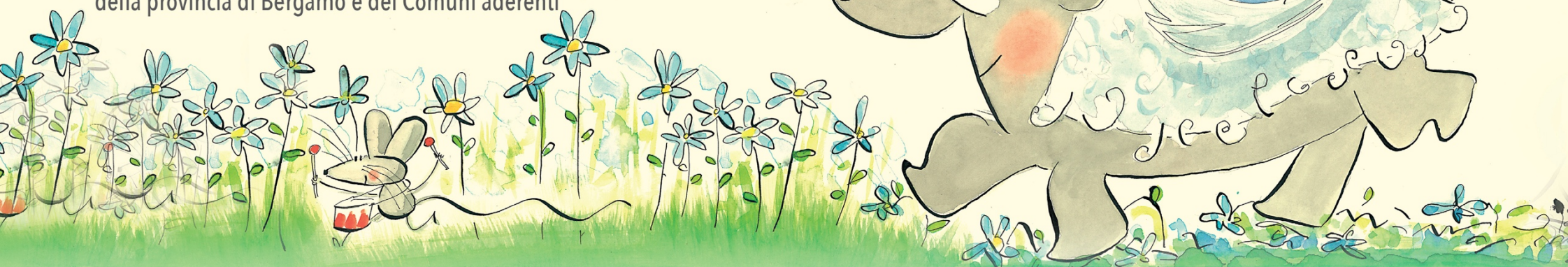
illustrazione di Margit Kröss

Con l'adesione e il contributo dei Sistemi Bibliotecari Intercomunali dell'Area di Dalmine e dell'Area Nord-Ovest della provincia di Bergamo e dei Comuni aderenti